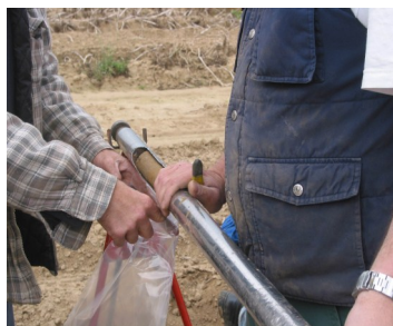
Prélèvement de sol