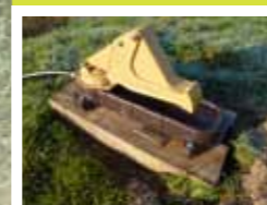
Pompe à museau