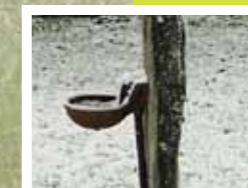
Eau de conduite